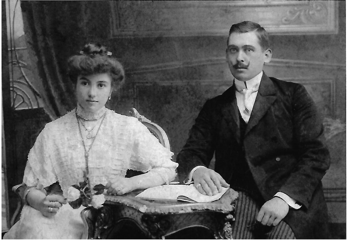
Melanija sa suprugom